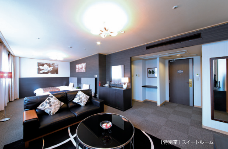
【特別室】スイートルーム

リゾート感溢れる広々とした癒しの空間で、ご旅行・ご出張で疲れた心と体をゆったりとおもてなし、心ゆくまでおくつろぎいただけます。 本館は、洋間と畳の間を備えた特別室から和洋室まで6種類、新館はベッドを繋げてダブルベッドとしてご利用できるハリウッドスタイルのツインルームや、ツインルーム2部屋のコネクティングルームを含む3種類のお部屋をご用意。