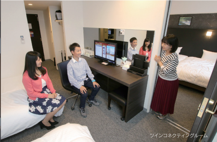
ツインコネクティングルーム

本館・新館共に、蛇口からは当ホテル自慢の「源泉100% うずしお温泉」と同じ源泉の温泉水が出てきますので、お部屋でも温泉がお楽しみいただけます。 また、本館・新館共にバリアフリールームをご用意。車椅子でも余裕を持ってご利用いただける広いベッドルームとバリアフリー対応の部屋風呂を完備し、快適にお過ごしいただけます。